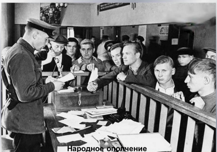
Народное ополчение Запись добровольцев

По официальным данным, за годы войны на фронт ушло 455000 красноярцев, это каждый пятый житель края. Было сформировано, обучено и отправлено на фронт более 30 военных соединений и