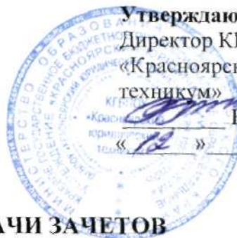
ГРАФИК ПЕРЕСДАЧИ ЗАЧЕТОВ

для студентов II курса очной формы обучения (гр. №№ 260-О, 261-О, 262-О, 267-ОП, 268-ОП, 163-П, 264-П, 265-П, 266-П, 269-П)